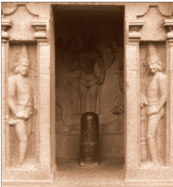
Shivalingam-Skulptur, Mamallapuram, Indien

Im taoistischen China heißt der Lingam »Jadestab« oder »Karmesinvogel«. In dieser Kultur wurden Lingam und Yoni als heilende und wichtige Teile des Körpers aufgefasst, die genauso der Berührung, Pflege und Liebe bedürfen wie der rest-