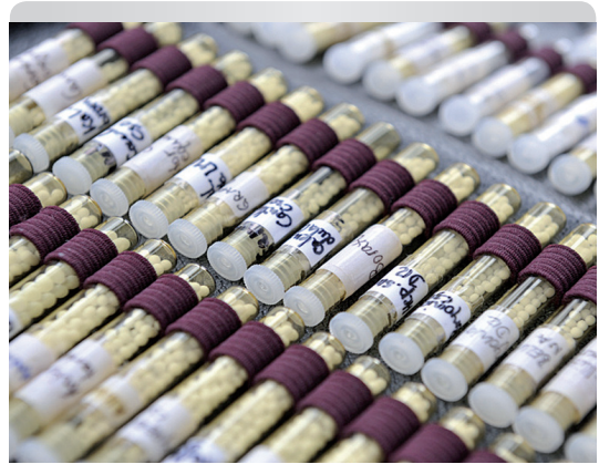
In der Homöopathie gilt: „Similia similibus curentur“ – „Ähnliches werde durch Ähnliches geheilt“. Im Bild: eine homöopathische Reiseapotheke

Unzählige Heilkundige verbreiteten die Homöopathie noch zu seinen Lebzeiten und auch nach dem Tod Hahnemanns in Europa, Nord- und Südamerika, Asien, Afrika und Australien.