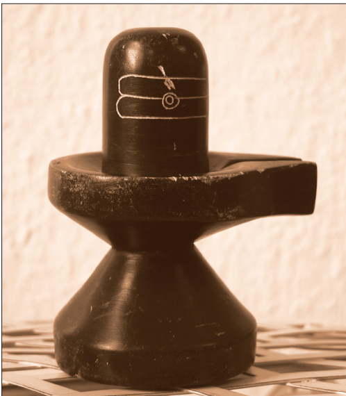
Der Shiva-Lingam in der Yoni-Schale

Der Shiva-Lingam (Lingam ist das Sanskritwort für Penis bzw. Phallus)